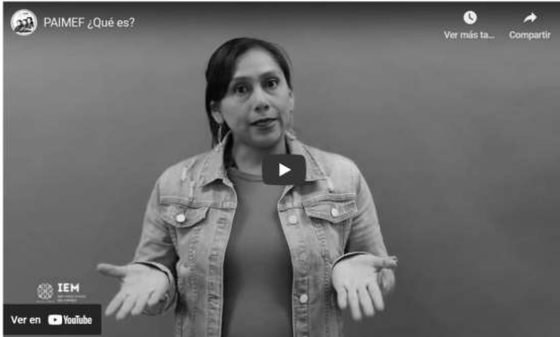
Ilustración 2. Video ¿Qué es el PAIMEF?